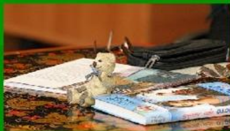
Медвежонок – талисман Е.Габовой