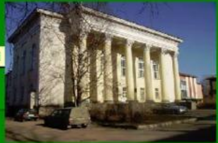
Национальная библиотека Коми